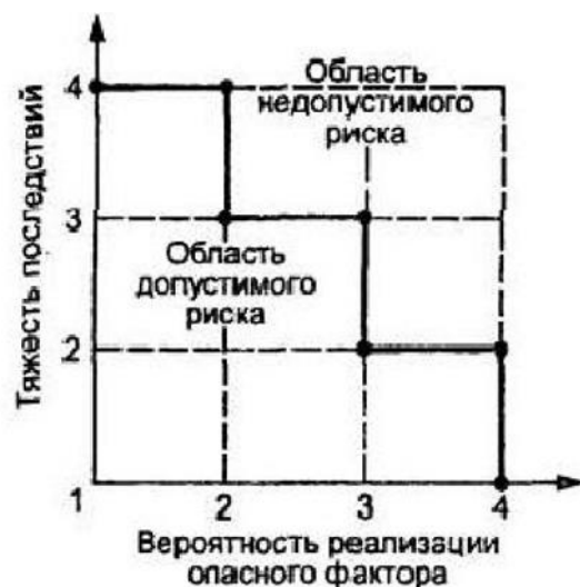
Таблица анализов риска при приготовлении и потреблении блюд.